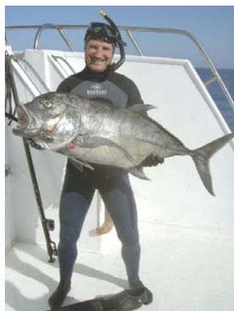
Красное море 2004. Каранкс 25 кг

Готовый фильм длился всего 15 мин, а материала было отснято очень много. К сожалению, плёнка куда то затерялась, и проспект уплыл. Остался только материал Betacam без звука, отснятый с монитора (выложен на youtube).