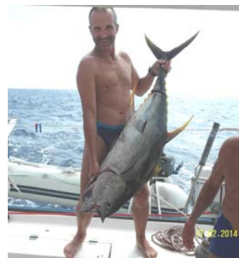
Куба. Карибское море. Тунец 50 кг. Bella Signora. Февраль 2014

В 2002 г я завоевал звание мастера подводного спорта.